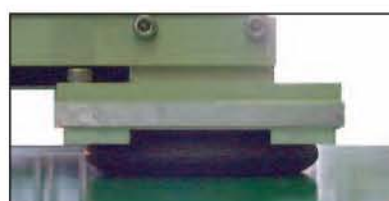
エアーで浮き上がった状態